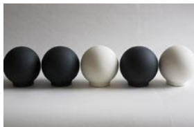
9 © Lena Willhammar