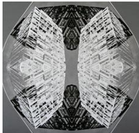
2 Theresia Lynch