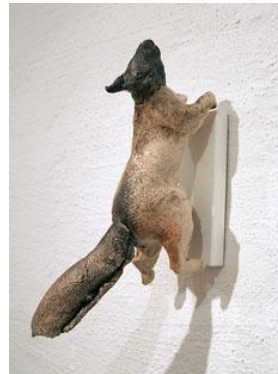
3 © Gunilla Sundström