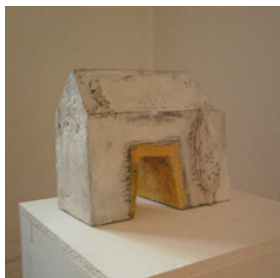
6 © Elisabet Svensson