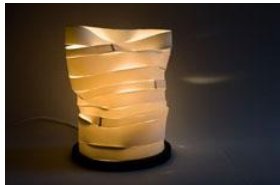
1 Alikka Garder Peterson